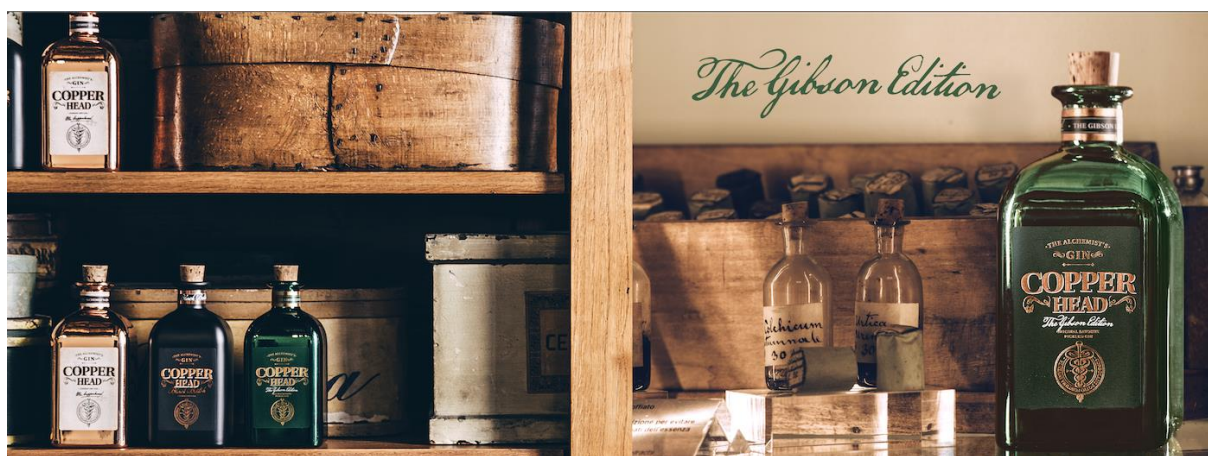
The Gibson Edition verpakt in een Jaguar groene fles is een permanente toevoeging aan het Copperhead gamma.